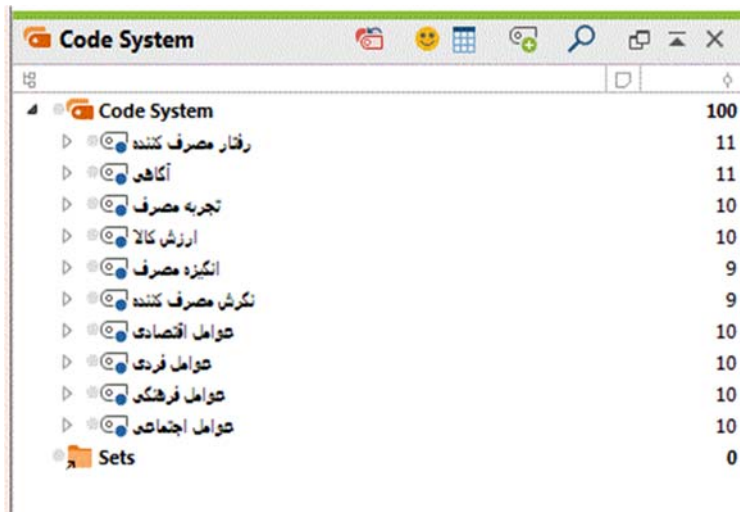
شکل ۲- نمایشی از استخراج مضامین در نرم افزار

مرحله چهارم زمانی شروع می شود که محقق مجموعه ای از تم ها را ایجاد کرده و آنها را مورد بازیابی قرار می دهد. این مرحله شامل دو مرحله بازیابی و تصفیه تم ها است.