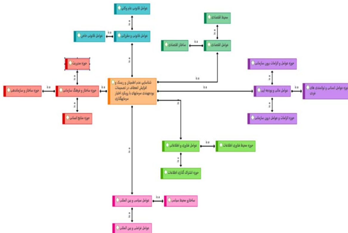
شکل ۲- الگوی برای شناسایی عدم اطمینان و ریسک و افزایش انعطاف در تصمیمات بودجه بندی سرمایه‌ای با رویکرد اختیار سرمایه گذاری کیفیت تحلیل کیفیت انجام شده (خروجی اطلس تی)

از چهار معیار کمی برای بررسی قابلیت اعتبار، قابلیت انتقال، قابلیت تأیید و اطمینان پذیری استفاده شده است: ضریب هولستی، ضریب پی اسکات، شاخص کاپای کوهن و آلفای کریندروف.