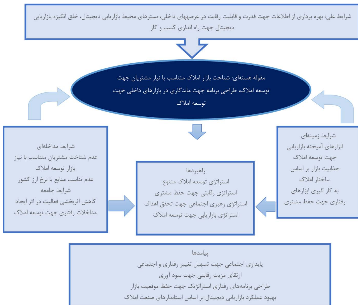
شکل ۱. مدل مفهومی پژوهش برگرفته از روش کیفی

مدل استخراج شده از روش کیفی به صورت زیر می‌باشد: