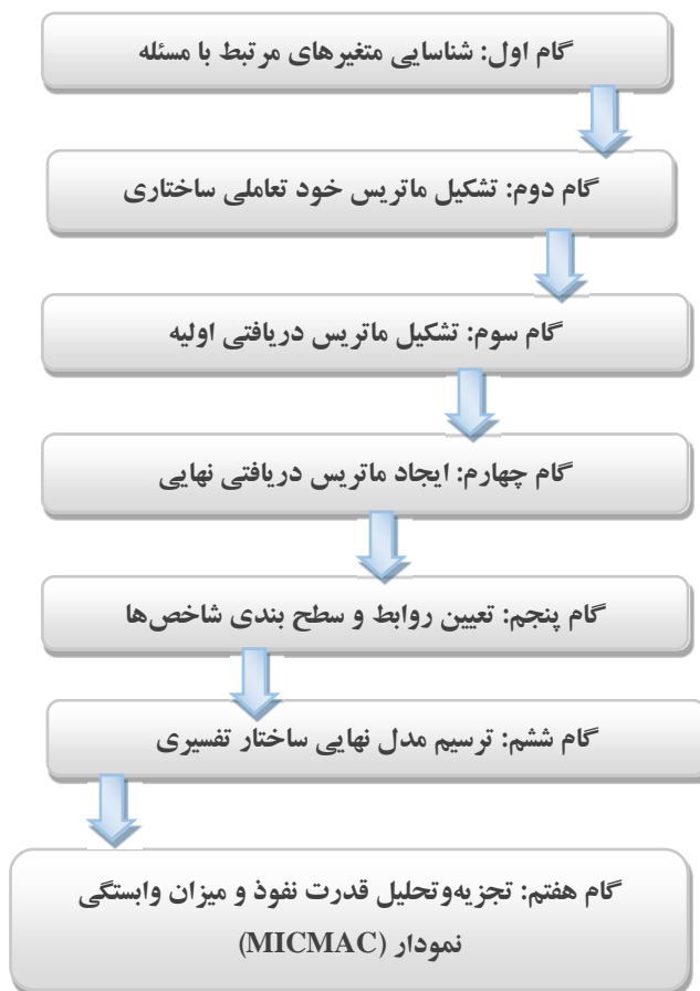
شکل ۱- مراحل انجام پژوهش

در مدل‌سازی به روش ISM که روشی ساختار تفسیری است که به وسیله وارفیلد مطرح گردید. در این روش، با تجزیه معیارها در چند سطح مختلف، به تحلیل ارتباط بین شاخص‌ها پرداخته می‌شود. این مدل ساختار تفسیری قادر است سطوح ارتباط بین شاخص‌ها که به صورت تکی یا گروهی به یکدیگر وابسته‌اند، را تعیین نماید. به عبارت دیگر، ISM می‌تواند برای تجزیه و تحلیل ارتباط بین ویژگی‌های چند متغیر که برای یک مساله تعریف شده‌اند، استفاده شود.